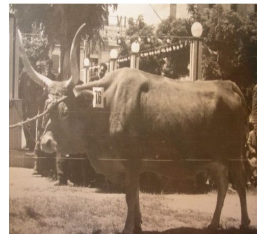
Vaca Cachena .

Ao final da intervención do Dr. Conde, terá lugar una breve presentación do seu recente libro e poderanse adquirir exemplares que o propio autor poderá asinar a toda persoa interesada.